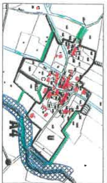
Hameau du Centre (Echelle : 1/5000)