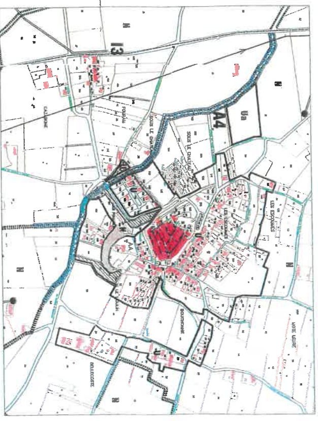
Village de MONTAUT, des hameaux de FOURAN et BELLECOSTE, (Echelle : 1/5000)